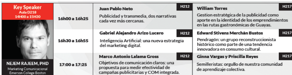
Figura 24. Lista de participantes 1er Congreso Académico de Publicidad del Ecuador – Pub 2018